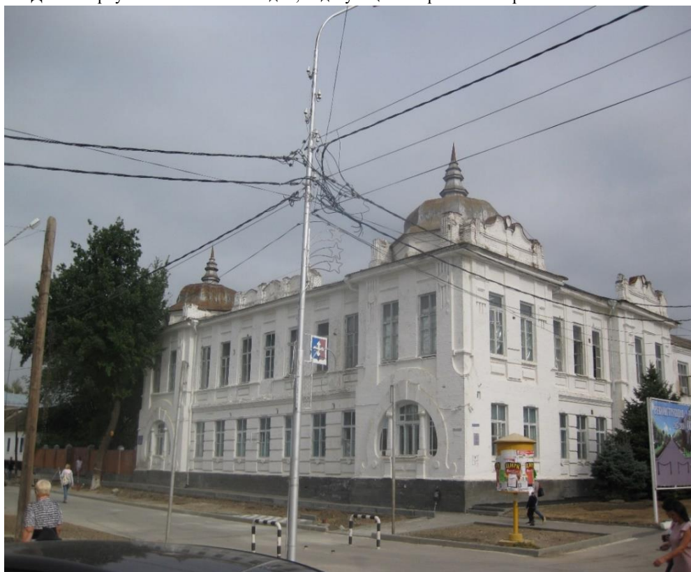
Дом нотариуса Соколова, в наши дни, вид с улицы Октябрьской (Александровской)