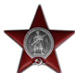
Орден Красной Звезды 1945г.