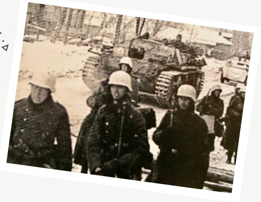
Немецкие войска входят в Клин