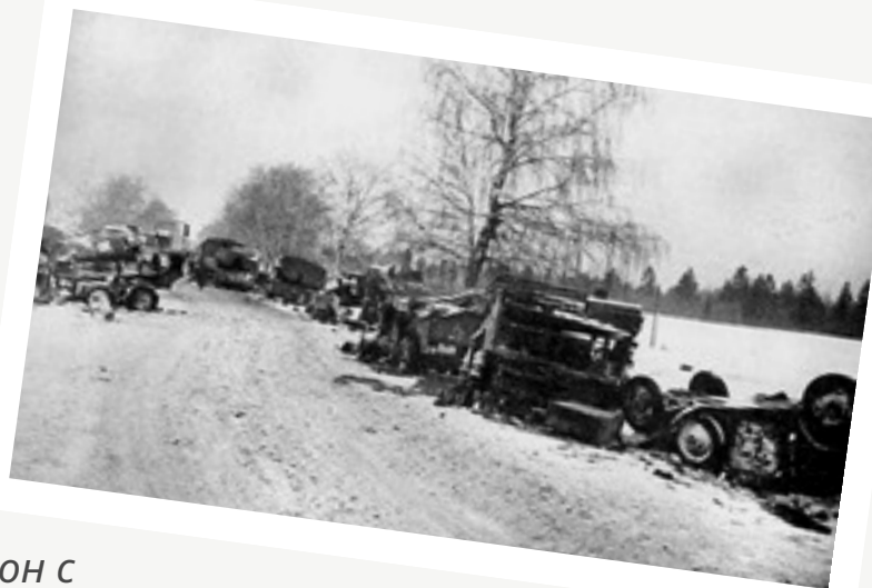
Разбитый эшелон с немецкой военной техникой на станции Клин