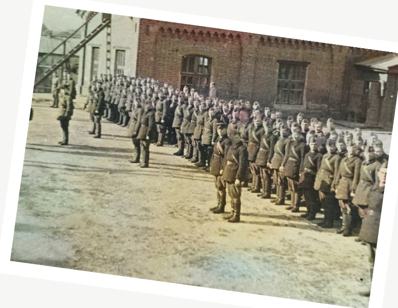
Экипаж бронепоезда «За Сталина» собранный из добровольцев жителей Коломны

Это было на Гжатском направлении, в 174 километрах к западу от столицы, возле станции Котельники. Шквал огня обрушил бронепоезд на врага. Однако немецкая артиллерия, танки и авиация наносили тяжёлые повреждения... Два часа сражался бронепоезд. Когда бой был закончен, только часть экипажа добралась до базы. Но задача была выполнена. Ценой своих жизней команда бронепоезда на несколько часов блокировала продвижение немецких войск к Москве. Спустя годы на месте гибели первого бронепоезда под Гжатском (ныне Гагарин) был заложен обелиск, который и по сей день посещают коломзаводцы, отдавая дань памяти своим героическим землякам.